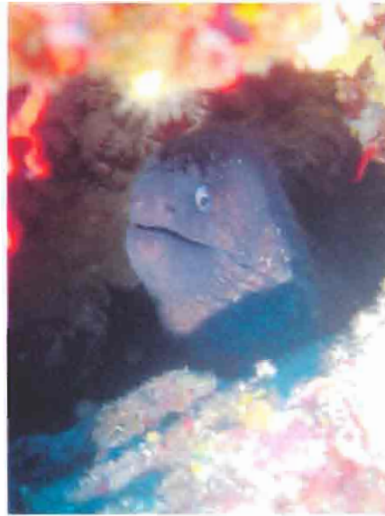
Braune Muräne ( Gymnothorax unicolor ) in den Felsen von «Cap Morgiou» Murène brune ( Gymnothorax unicolor ) dans les roches de «Cap Morgiou»