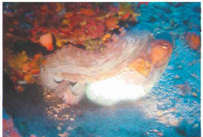
Octopus ( Octopus vulgaris ) am «Cap Morgiou» Poulpe ( Octopus vulgaris ) au «Cap Morgiou»