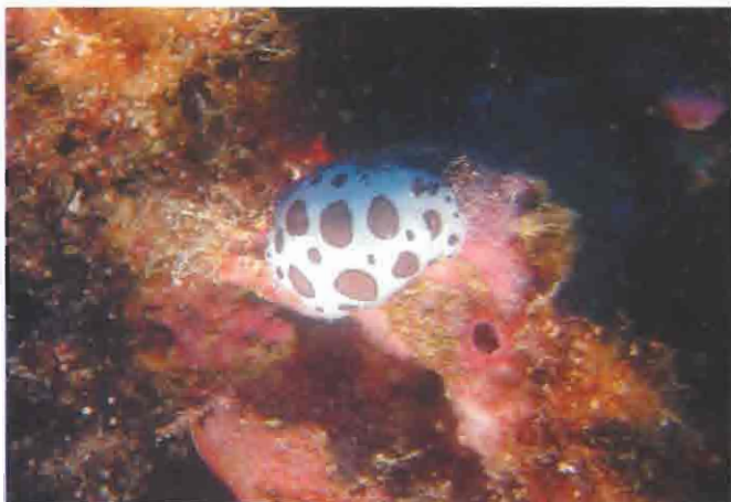
Nacktkiemenschnecke ( Peltodoris atromaculata ), häufig vorkommend im Mittelmeer Doris dalmatien ( Peltodoris atromaculata ). Nudibranche commun en Méditerranée